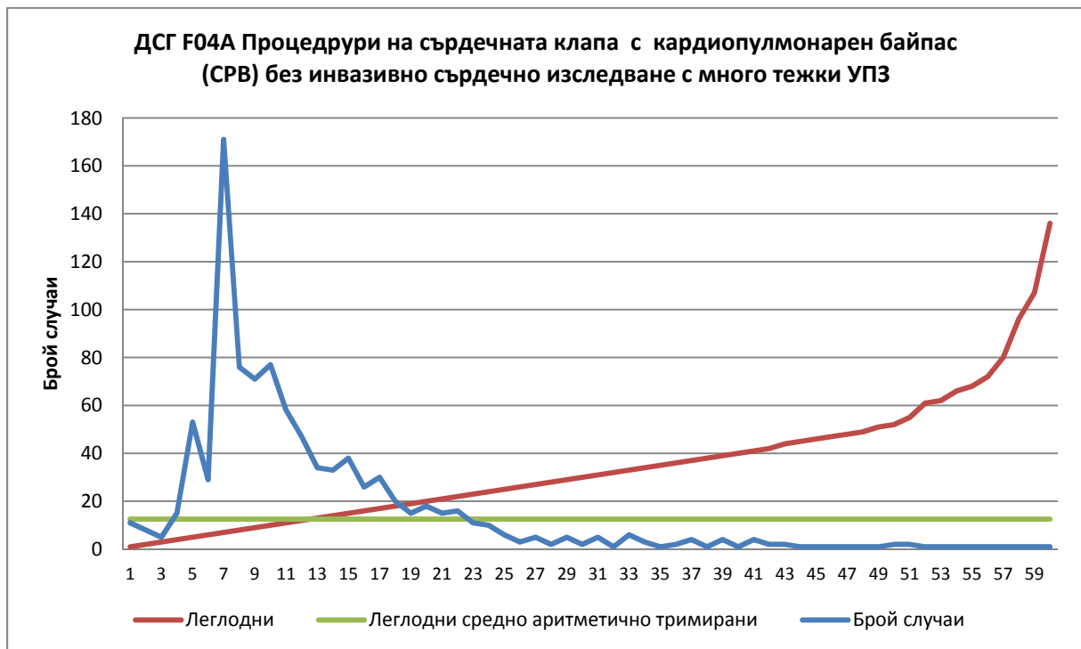
Фигура 1. Съотношение на броя случаи и продължителност на престоя в леглодни по случаи и средно аритметично тримирани при ДСГ F04A

От графиката е видно несиметричното разпределение на броя случаи според продължителността на престоя при ДСГ F04A. На много случаи са разположени в интервала между 4 и 23 леглодни.